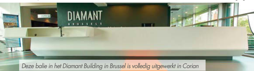
Deze balie in het Diamant Building in Brussel is volledig uitgewerkt in Corian