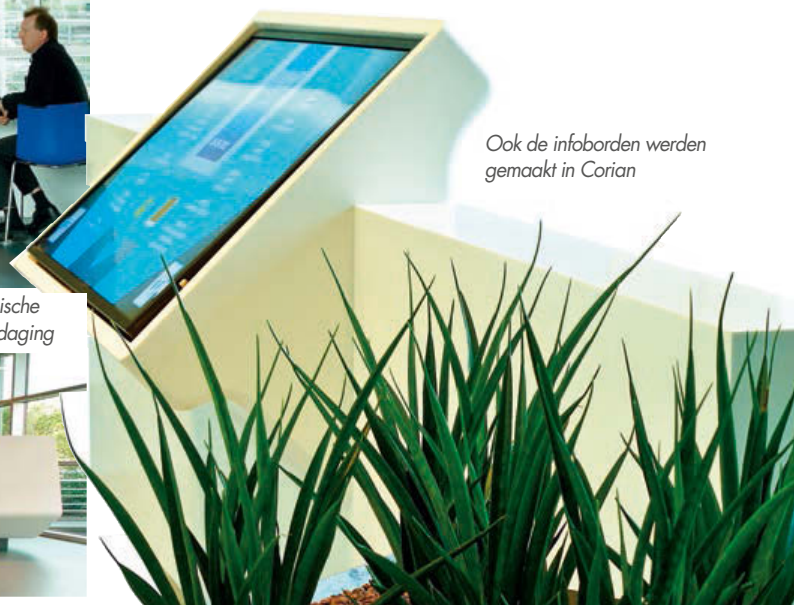
Ook de infoborden werden gemaakt in Corian