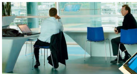
Interieurarchitecten ontwerpen graag meubels met organische vormen. Voor de interieurbouwer vormen ze een hele uitdaging