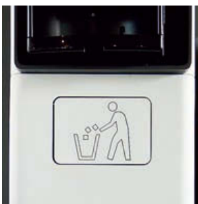
Dit logo werd in het Corian gelaserd

"Welke weg we de volgende jaren zullen inslaan, is nog niet duidelijk. Al vermoed ik dat we – om onze positie te versterken – moeten mikken op klanten die bijzondere meubels wensen. Wij zijn dan ook bereid om ons verder te specialiseren in nieuwe technieken en het verwerken van nieuwe materialen. Als er daarvoor nieuwe investeringen in machines nodig zijn – iets wat we de jongste jaren niet meer gedaan hebben, omdat we alles wat we nodig hebben, in huis hebben – dan zullen we dat zeker doen. Ten slotte droom ik er ook van om op het perceel grond dat naast ons bedrijf ligt, een volledig afgewerkte woning te bouwen in samenwerking met een vier- of vijftal andere firma's. Ik denk hierbij aan een elektricien, een loodgieter, een schilder ... In die woning zouden we echt alle mogelijkheden en technieken op een realistische manier kunnen tonen. De betrokken firma's zouden samen totaalprojecten kunnen realiseren, terwijl ze een heleboel gemeenschappelijke kosten evenredig zouden kunnen verdelen. Voorlopig is dit nog maar een idee dat in mijn hoofd is ontstaan. Of en wanneer ik ermee naar buiten treed om geïnteresseerde partners te zoeken, is nog de vraag." □